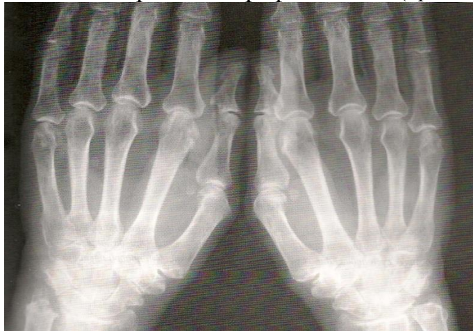
Рентгенограмма кистей к запястьям

в неделю внутрь, фолиевая кислота 5 мг в неделю, диклофенак 150 мг в день. При осмотре болезненность и припухлость локтевых, л/запястных, 2–3 ПФ, ПМФ суставов кистей, правого коленного, болезненность ПлФ суставов. В анализе крови: гемоглобин 101 г/л, лейкоциты 5,6 10 9 /л, тромбоциты 320 10 9 /л, СОЭ 36 мм/ч, СРБ 46 мг/л. Выполнена рентгенография кистей (прилагается).