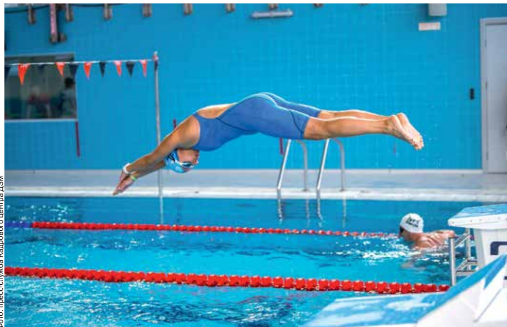
▲ Команды состояли как из женщин, так и из мужчин