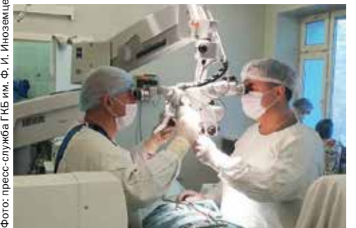
▲ Нейрохирурги ГКБ имени Ф. И. Иноземцева за работой