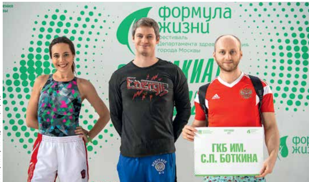
▲ Пловцы Городской клинической больницы имени С. П. Боткина стали лучшими в командном зачете