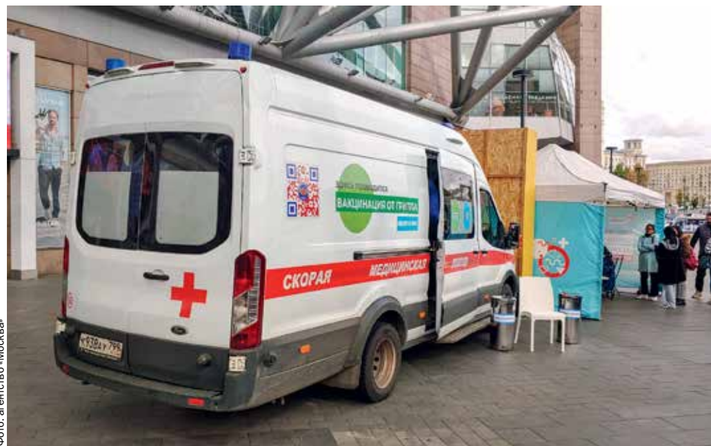
▲ Мобильные пункты вакцинации расположены возле метро, МЦК и МЦД

15 мобильных пунктов вакцинации от гриппа работают в этом году.