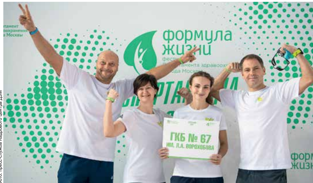
▲ В командном зачете Городская клиническая больница имени Л. А. Ворохобова заняла второе место