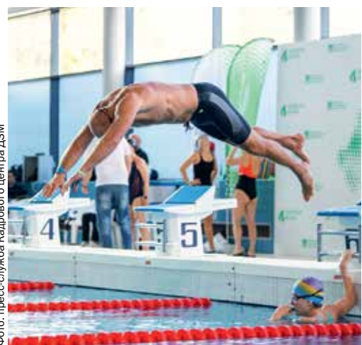
▲ Каждый стремился установить личный рекорд